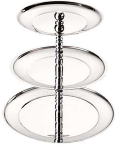
Katlı Meyvelik Layered Fruit Rack