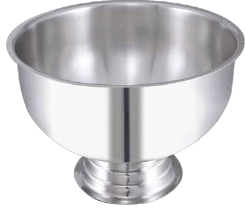
Punch Kase Puch Bowl