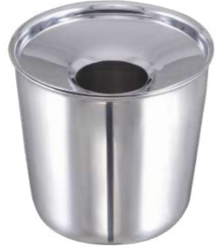
Masa Üstü Çöp Kovası Table Top Trash Bin