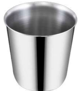
Su Bardağı Konik Conic Water Cup

Not:Kalınlıklar +/- 0,03 mm. değişiklik gösterebilir