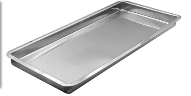
Servis / Kasap Tepsisi Service / Butcher Tray

Ölçüler içten içedir. / . Dimensions are internal.