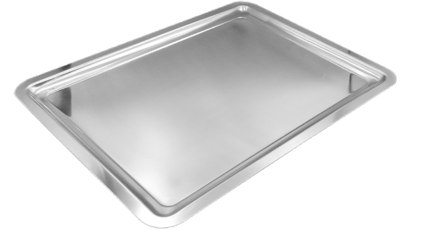
Pastane Tepsisi Bakery Tray

Ölçüler içten içedir. / . Dimensions are internal.