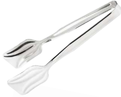
Salata Maşası Klasik Model Salad Tong Classic Model