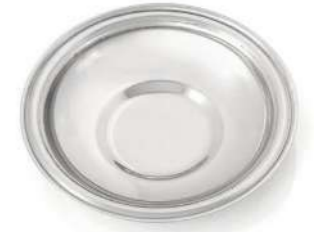
Çay Tabağı Sade Tea Plate Plain