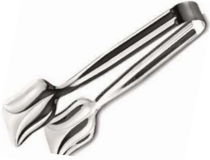
Pasta Maşası Klasik Model Cake Tong Classic Model