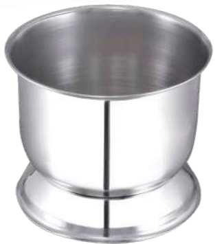
Dondurma Kaşıklığı Ice Cream Spoon Bucket