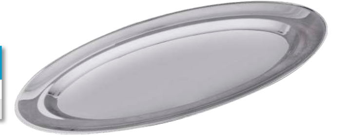
Pide & Balık Tabacağı Pita & Fish Plate