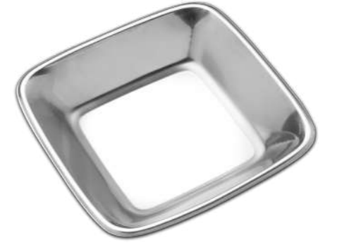
Çay Tabağı Kordonlu Tea Plate with Cord