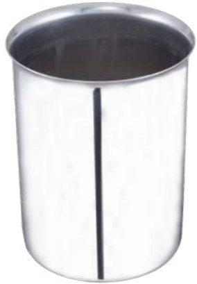
Küver Kabı Quarry Pot

Not:Kalınlıklar +/- 0,03 mm. değişiklik gösterebilir