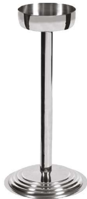
Şampanya Kovası Stantı Champagne Bucket Stand