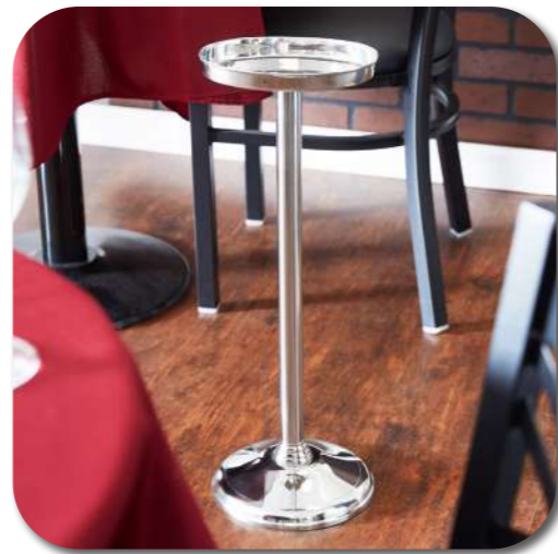
Piramid Şampanya Kovası Pyramid Champagne Bucket