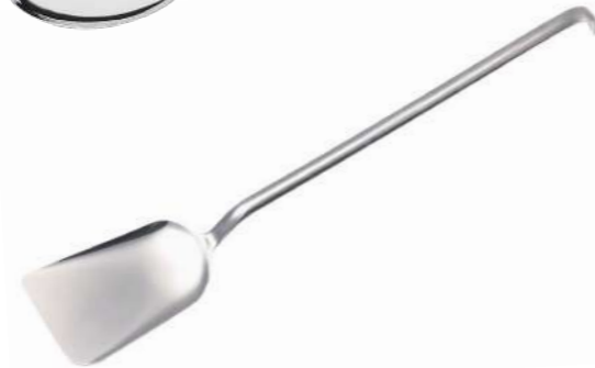
Spatula Düz Flat Spatula