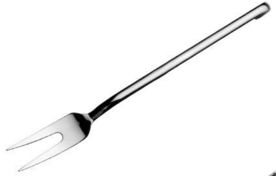
Servis Çatalı Service Fork