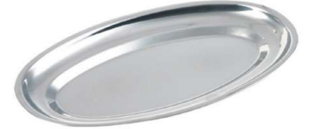
Battal Kayık Tabak Oversized Service Plate