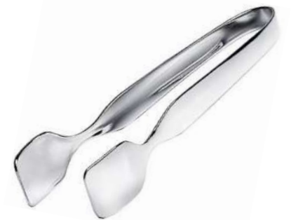
Şeker Maşası Klasik Model Sugar Tong Classic Model