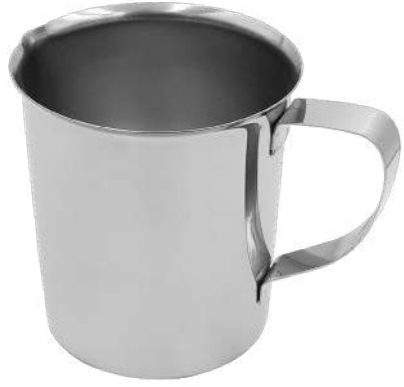
Kapaksız Sürahi Jug without Lid

Not:Kalınlıklar +/- 0,03 mm. değişiklik gösterebilir