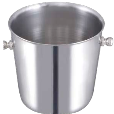
Konik Buz Kovası (izolesiz) Conical Ice Bucket (non-insulated)