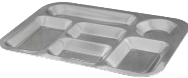
Altı Gözlü Kahvaltı Tabacağı Self Service Tray 6 Compartment

Not:Kalınlıklar +/- 0,03 mm. değişiklik gösterebilir