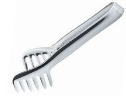
Makarna Maşası Klasik Model Pasta Tong Classic Model