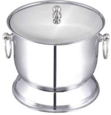
Ayaklı Buz Kovası Kapaklı (izoleli) Footed Ice Bucket with Lid (insulated)