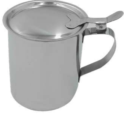
Kapaklı Sürahi Jug with Lid