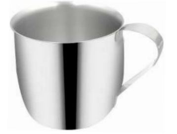
Nescafe Bardağı Nescafe Cup