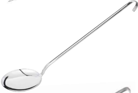
Pilav Kaşığı Rice Spoon