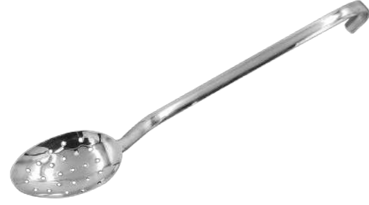
Servis Kaşığı Delikli Service Spoon Perforated