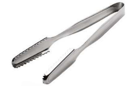
Buz Maşası Klasik Model Ice Tong Classic Model