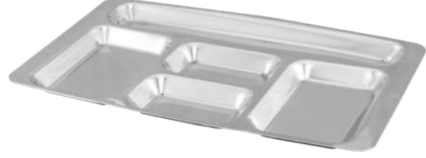
Beş Gözlü Kahvaltı Tabacağı Self Service Tray for Breakfast 5 Compartment