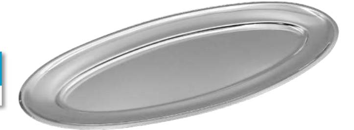
Diplomat Servis Tabacağı Diplomat Service Plate