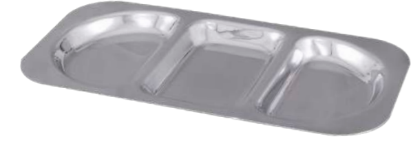
Üç Gözlü Kahvaltı Tabacağı Self Service Tray For Breakfast 3 Compartment

Not:Kalınlıklar +/- 0,03 mm. değişiklik gösterebilir